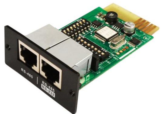
Przedmiot nr. 10120565

Implementuje protokół Modbus RTU do komunikacji z komputerami PC