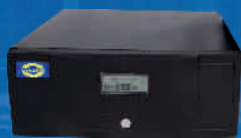
Inverter ORVALDI INV12-840W