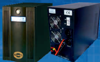
Inverter ORVALDI INV24-1kW i INV48-2kW