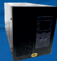
ORVALDI KC-2000L SINUS USB 1,4kW