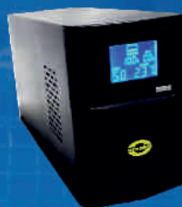
ORVALDI KC-1000L SINUS USB 700W