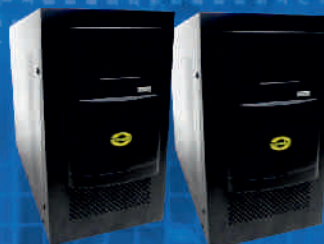
ORVALDI KC-3000L SINUS USB 2,1kW KC-5000L SINUS USB 3,5kW