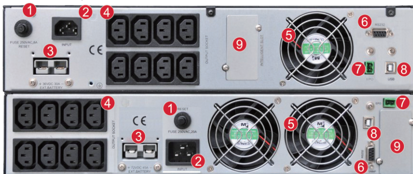
GT S 11 3kVA RT