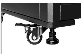
Regulowane nóżki poziomujące i kółka (2 z hamulcem)