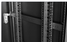
Szyny montażowe z regulacją