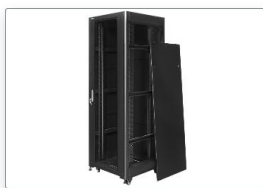
Zdejmowane boczne ścianki