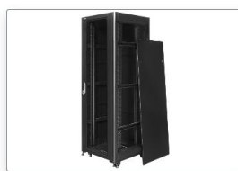
Zdejmowane boczne ścianki