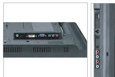
Universalne połączenia: VGA, DVI, HDMI, Kompzytowe, Komponentowe