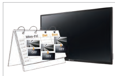
Wbudowana funkcja harmonogramu pozwala w łatwy sposób zarządzać źródłem sygnału wejściowego