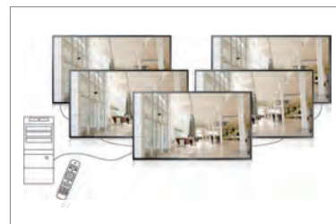
Porty RS-232/RJ45 przeznaczone do kontroli zdalnej